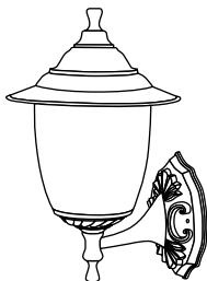
Настенный плафон вверх